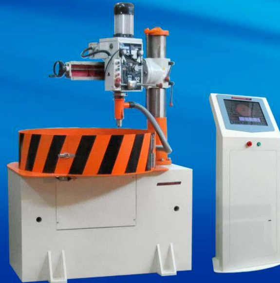
ТБ Верт 250