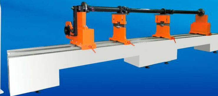
ТБ Кардан 4000